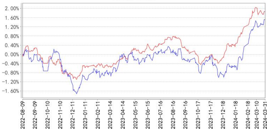
平安盈福6个月持有债券（FOF）A累计净值增长率与同期业绩比较基准收益率的历史走势对比图

— 平安盈福6个月持有债券（FOF）A累计净值增长率 — 平安盈福6个月持有债券（FOF）A累计业绩基准收益率